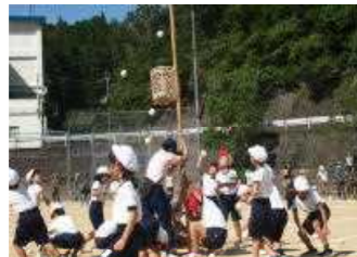
ダンシング玉入れ(1,2年)

保護者の皆様には、多数ご参観いただき、子どもたちに温かいご声援をいただきありがとうございました。