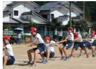
ツナリンピック2021(5,6年)