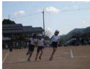
ゴー!ゴー!台風ーン!(3,4年)